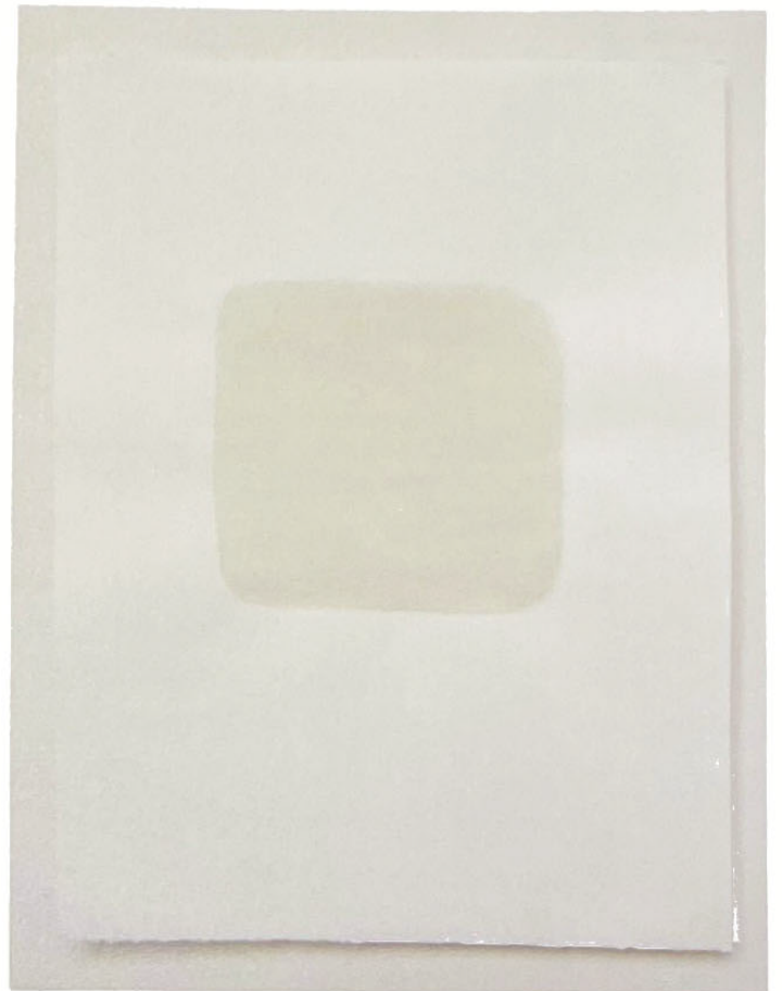
7-7 ジェームズ・ジャック 土のフィロソフィー： ダルトンウエルス、ユタ 76.0 × 56.0cm 平成 24 年（2012） 天然顔料、アラビアゴム、紙 作家蔵